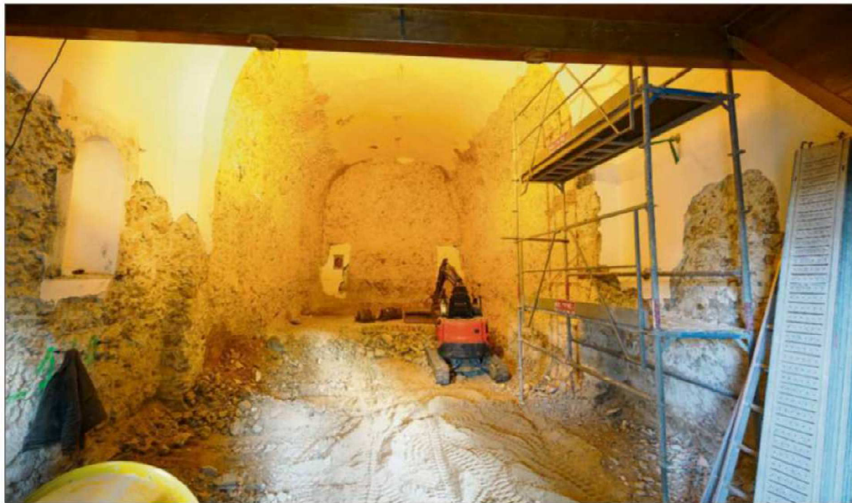
Totalement dénudé, l'intérieur de la chapelle va retrouver tout son lustre.

Les travaux de la petite chapelle avancent bien. Sera-t-elle finie pour le 19 mars prochain ? Tout sera fait pour, mais l'important est la réussite de la réhabilitation