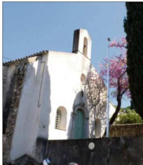
La chapelle Saint-Joseph, bientôt restaurée.